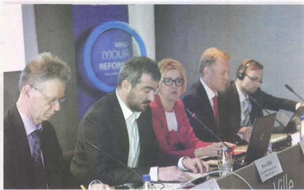
Radiće se i na jačanju eUprave: Sa radionice za civilni sektor

Generalni direktor Direktorata Ministarstva prosvjete za opšte srednje, sre-