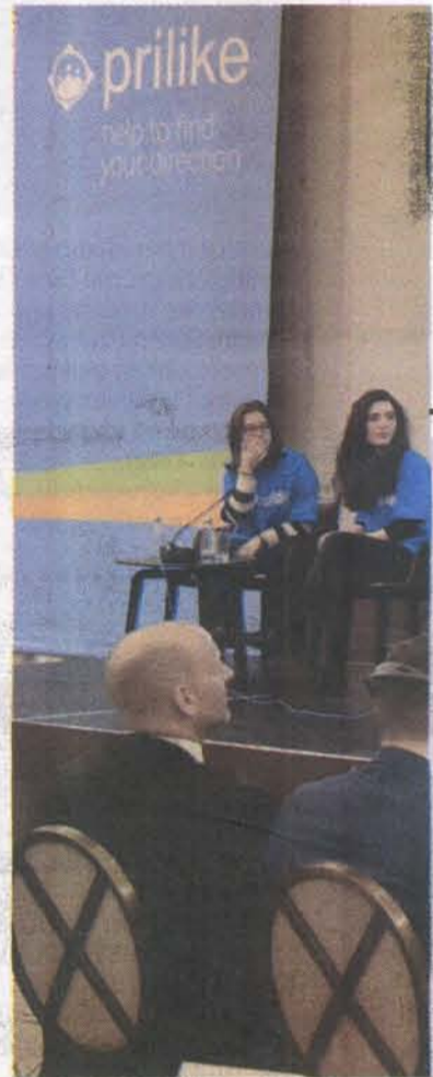
Učenici misle da je teoretsko