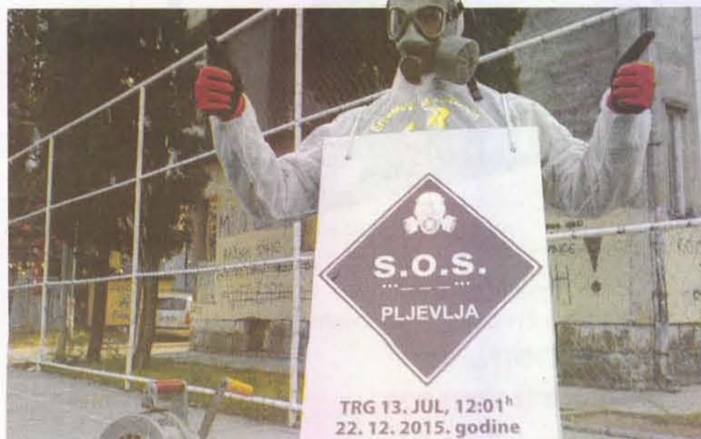
Agencija zove NVO u pomoć: Sa performansom (arhiva)

Agencija sprema plan mjera za rješenje situacije